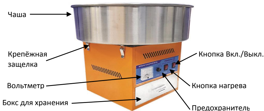
Рис.1 – Аппарат для приготовления сладкой ваты